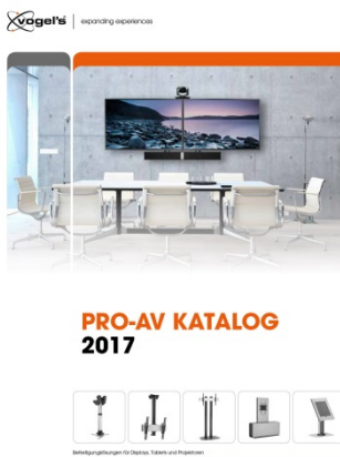
Vogel's PRO-AV KATALOG 2017

Vogel's®, Marktführer und Experte für professionelle Befestigungssysteme hat seinen neuen PRO-AV Katalog 2017 herausgebracht. Gefüllt mit innovativen Produkten, die den Anforderungen von Monteuren und Endbenutzern im hohen Maße entsprechen, setzt Vogel's, wie immer, die Qualität als eines seiner wichtigsten Kriterien an erste Stelle.